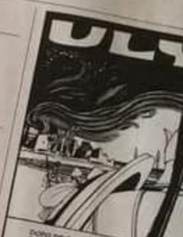
Dopo dieci anni di combattimenti feroce, il signor degli eroi ha sberleffiato