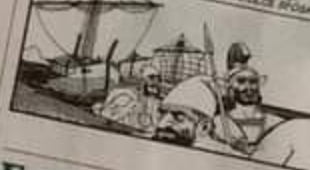
Tra loro c'è il grande e coraggioso Ulisse. Tra gli eroi, che si affrettano a partire per la loro patria, c'è il più grande di tutti, il più attento Penelope, la dolce sposa