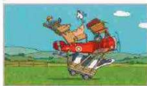
La «passeggiata nel cielo» di Yuici Kasano

72, € 22); proprio spassoso Una passeggiata nel cielo (Babalibri, pp. 36, € 11,50) di Yuici Kasano, con tanto di mobilità e animali; si descrivono in inglese La fattoria e il porto (Orecchio Acerbo, € 9,50 l'uno) che inaugurano Maps, collana di grandi poster e sticker ripositionabili; ci si diverte a completare e colorare le immagini ideate da Borando e Pica per Il libro bianco (Minibomb, pp. 48, € 12,90).