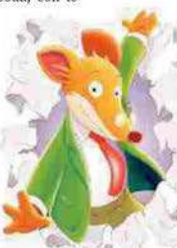
L'«inossidabile» Geronimo Stilton

Tra le novità in vetrina: la «Revolution» di Geronimo Stilton la Schiappa in latino, incontri con la Storia e zoo immaginari